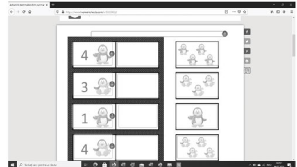
Figura 18. Activitate interactivă online

Pentru a le propune elevilor o anumită fișă, este suficientă alegerea ei, apoi distribuirea linkului acesteia (găsit în bara de sus). În acest fel, elevii o vor putea accesa și rezolva foarte ușor.