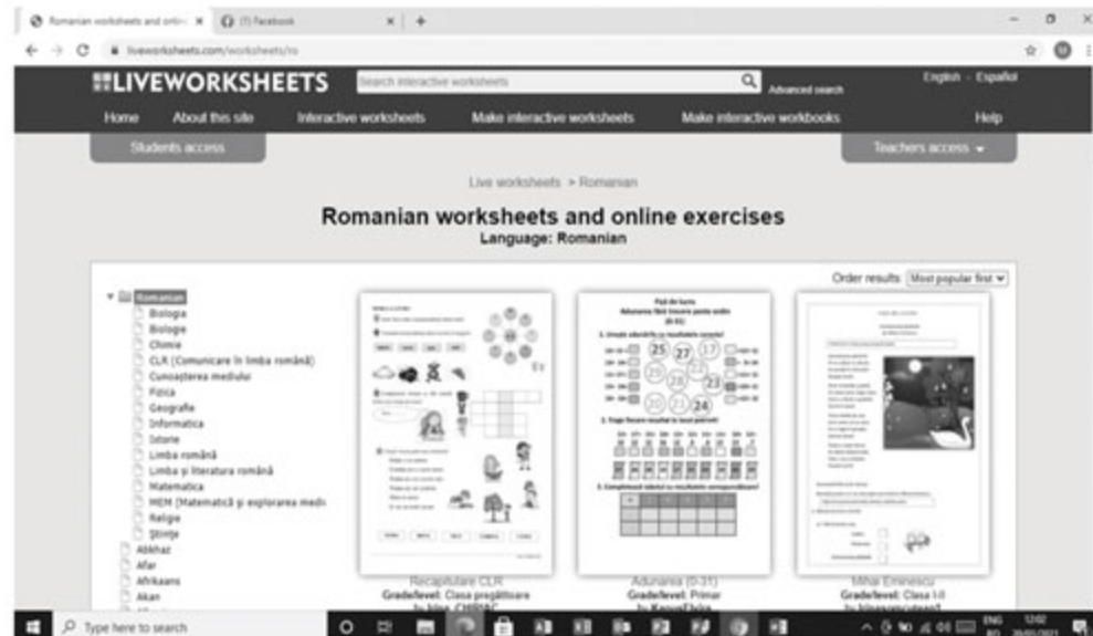
Figura 16. Accesare resurse pe Liveworksheets în limba română

Important! După cum se observă, există multe fișe cu exerciții online deja concepute!