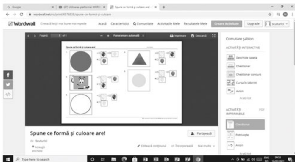
Figura 13. Șablonul chestionar

Important! Puteți schimba șablonul în funcție de tipul activității propus. De asemenea, cu un click, acest joc poate fi schimbat într-o fișă de lucru, adică în Activitate imprimabilă .