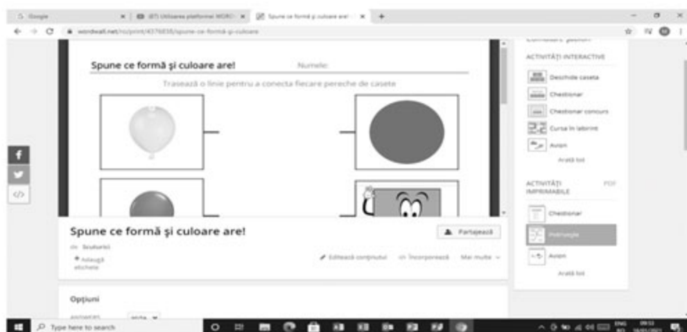
Figura 14. Activitatea imprimabilă

După cum se observă în imaginea de mai sus, pentru activitatea imprimabilă se poate alege șablonul Chestionar sau șablonul Potrivește .